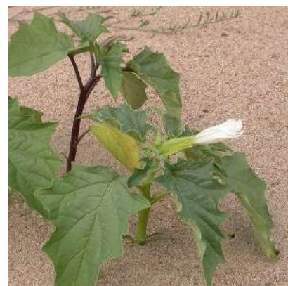
Datura stramonium

Elle pousse également dans divers milieux perturbés tels que les bords de route, talus, fossés, friches, berges... Elle affectionne les endroits secs et ensoleillés.